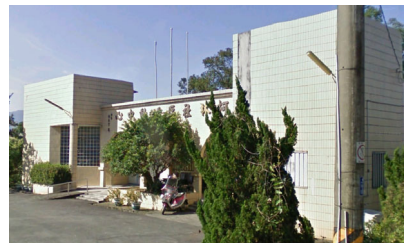
宜蘭縣政府消防局 112 年 03 月更新

柯林社區活動中心 面積：256.2 平方公尺 容納：54 人 地址：光華路 209 號 電話：0932-089-581 林明義理事長 適用災害類別：水災、震災、風災